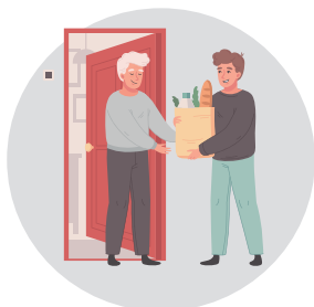
Aide aux courses