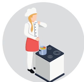
Aide à la cuisine