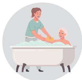
Aide à la toilette