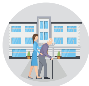
Entrée en établissement