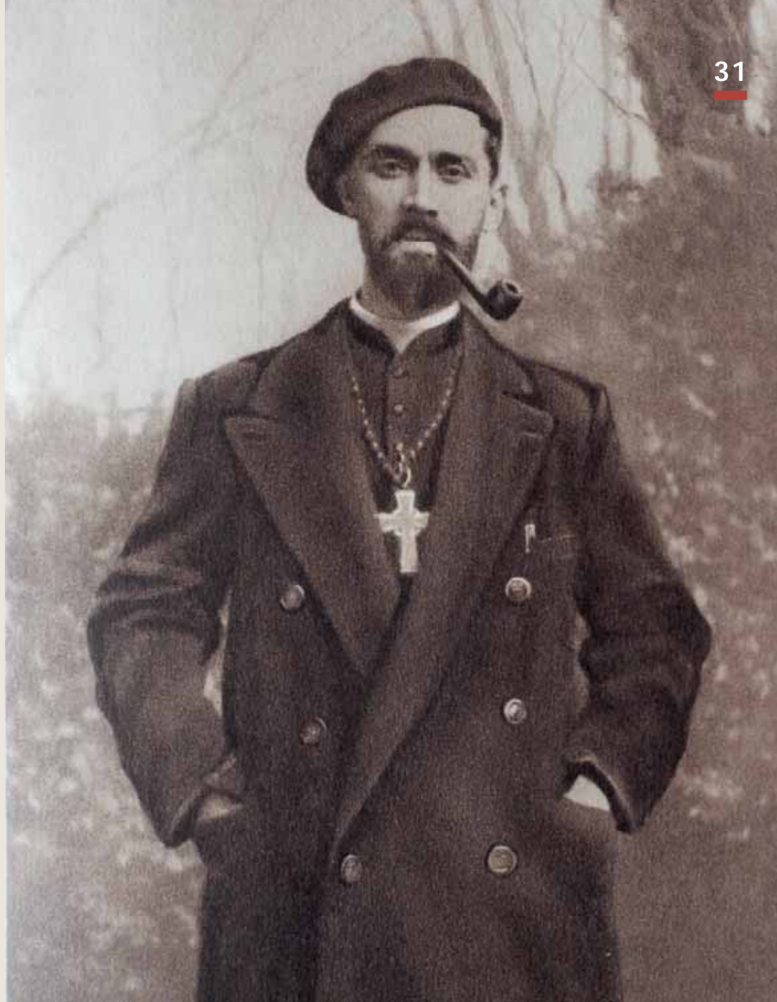
L'abbé en soutane avec sa bouffarde (sa pipe) .

la Croix de guerre. Fait prisonnier, il est envoyé en Silésie dans un oflag*. Il y organise des conférences, célèbre la messe chaque matin. En tant qu'aumônier, il est rapatrié vers une France désormais occupée. De retour à Saint-Brieuc, il s'engage dans la