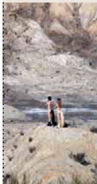
MIELNA, BRICHEL, DELGADO, JELICH

Chaque année désormais, la scène nationale briochine de La Passerelle se meut en site de festival pour concevoir et présenter sa propre manifestation. 360 degrés ,