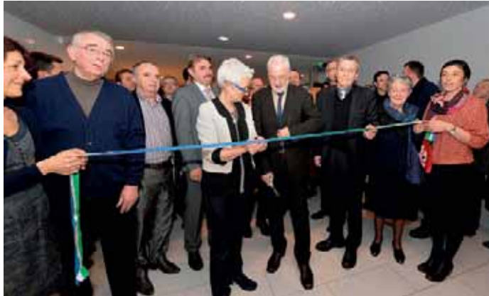
Les nouveaux bureaux sont situés 13 boulevard Louis-Guilloux à Lannion.

L e 6 février, le président Claudy Lebreton inaugurerait les nouveaux locaux de la Maison du Département (MDD) de Lannion. Avec les MDD de Guingamp, Saint-Brieuc, Loudéac-Rostrenen et Dinan (en cours), la décentralisation des services départementaux est en voie d'achèvement, afin de mettre à la disposition des Costarmoricains, dans chaque pays, une structure regroupant l'ensemble des services publics départementaux. Aides du Département, développement territorial, appui aux associations, accompagnement social, soutien aux personnes âgées, projets routiers, véritable espace citoyen d'information et de services, la MDD renseigne le public et l'accompagne dans ses démarches. « 60 % des agents du