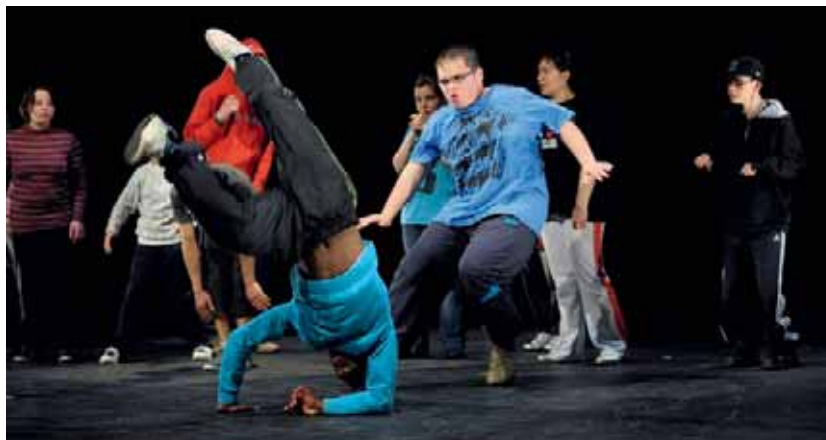
Les jeunes de l'IME Guy-Corlay de Saint-Brieuc sur scène lors du festival 2012.