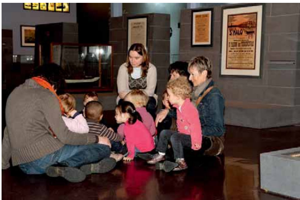
Des temps de médiation avec le public sont organisés.

➔ Musée d'art et d'histoire Cour Francis-Renaud, rue des Lycéens martyrs 22000 Saint-Brieuc Du mardi au samedi de 10h à 18h, les dimanches et jours fériés, de 14h à 18h. Entrée libre. musee@mairie-saint-brieuc.fr Pour retrouver toutes les animations organisées autour de l'exposition (visites, conférences, projection de film et création) : terreneuve-terreneuvas.fr